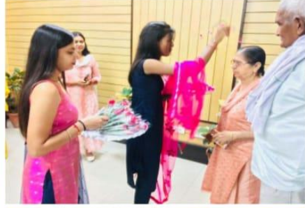
अगर सही में जीना चाहते हो तो पहले खुद से प्यार करना सीखो। उन्होंने कहा कि आज के युग में क्या हम अपनी