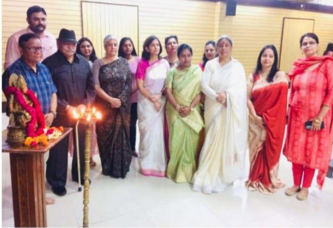
दैनिक कलश जागरण/मनीषा कुमारी फरीदाबाद। डी.ए.वी. शताब्दी महाविद्यालय में वाइ.आर.सी. युनिट,