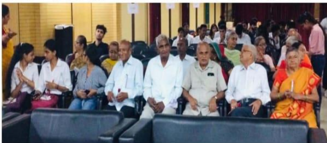
एन.एस.एस. युनिट, एन.सी.सी. युनिट और बी.कॉम विभाग ने एन.सी.डी. सेल व स्वास्थ्य विभाग के सहयोग से 'इंटरनेशनल डे ऑफ एलडर पर्सन' कार्यक्रम आयोजित किया। इस कार्यक्रम में महाविद्यालय के छात्रों के दादा-दादी व नाना-नानियों को आमंत्रित किया गया। महाविद्यालय की सेवानुवृत्त व वरिष्ठ नागरिक शिक्षक भी कार्यक्रम का हिस्सा बनीं। इस कार्यक्रम में विशेष अतिथि के