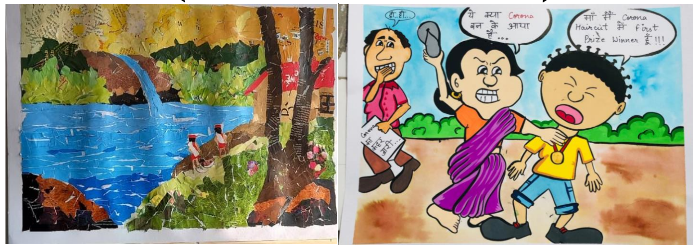
Collage (First position)