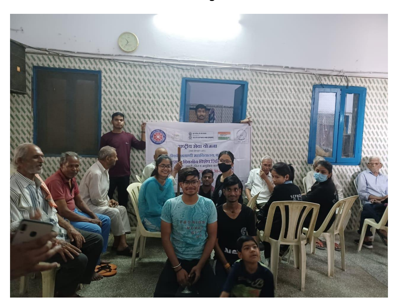
Roshni Students Performance