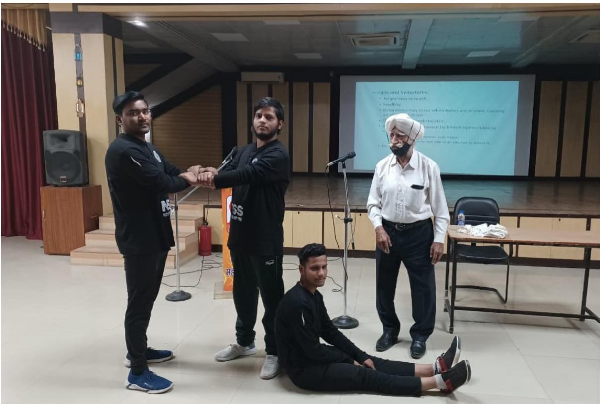
Swachh Bharat Abhiyan