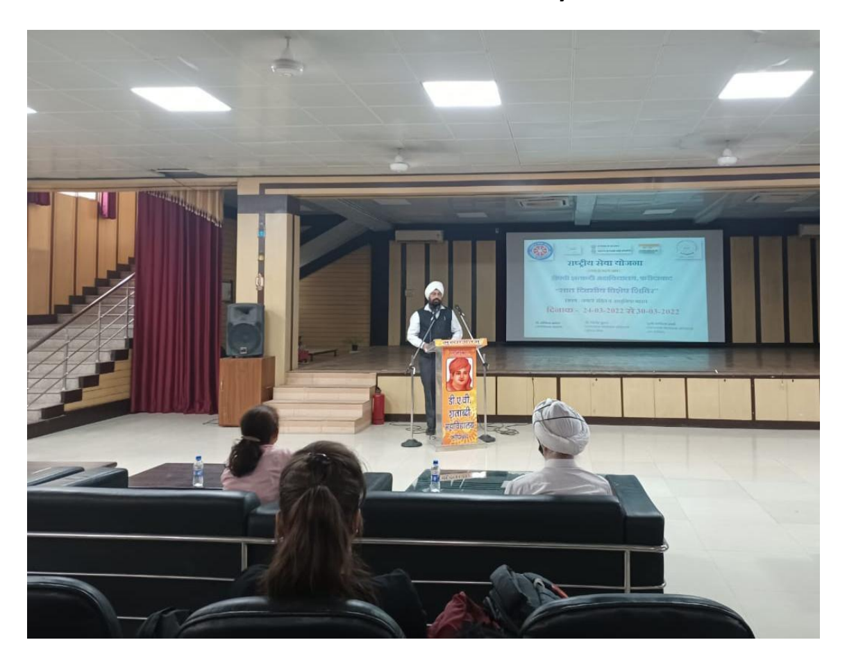
Eye donation Awareness Lecture